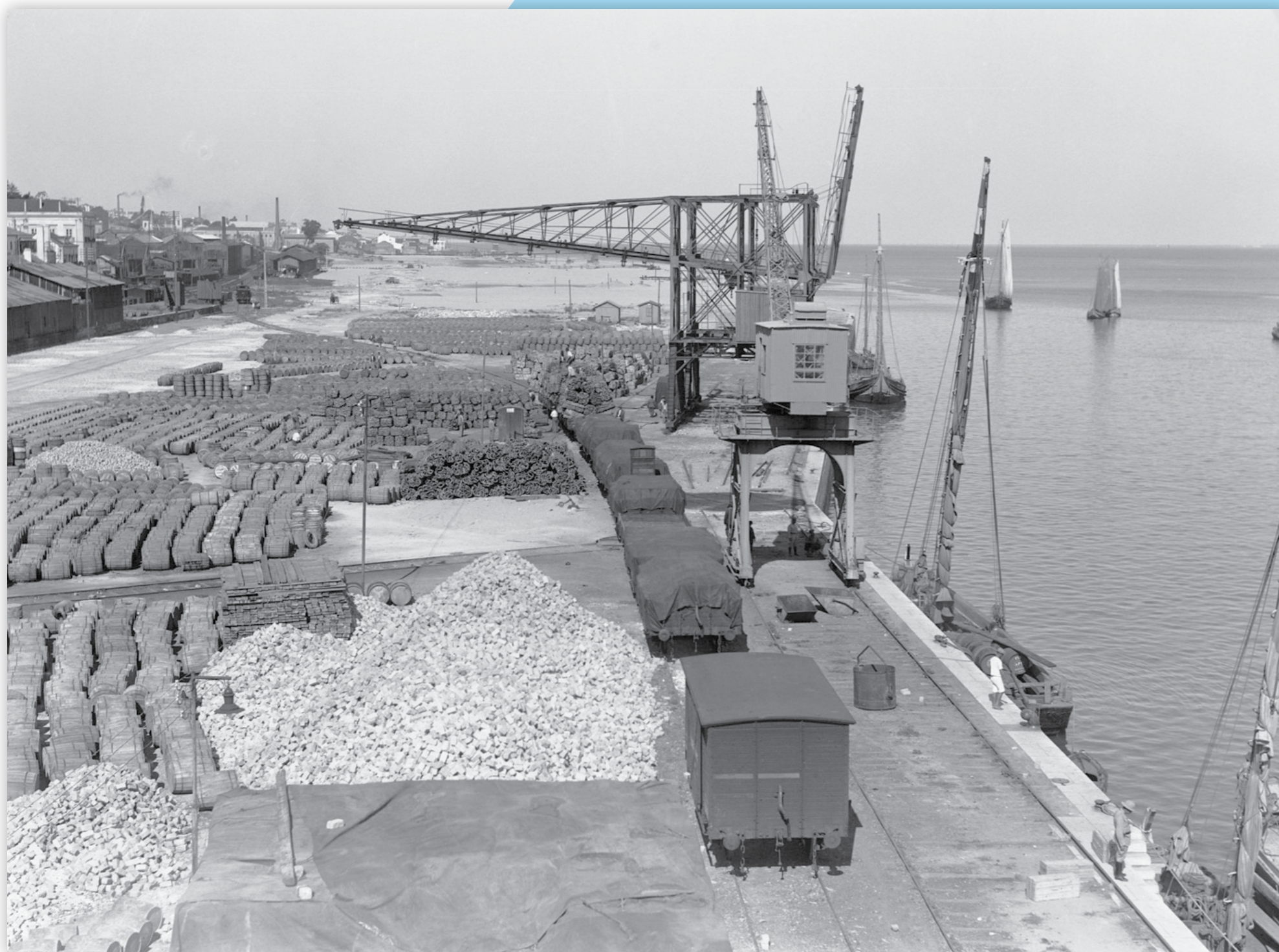
Carga no aterro do entreposto de Santa Apolónia. A carga é constituída principalmente por barricas de resina •Sem data