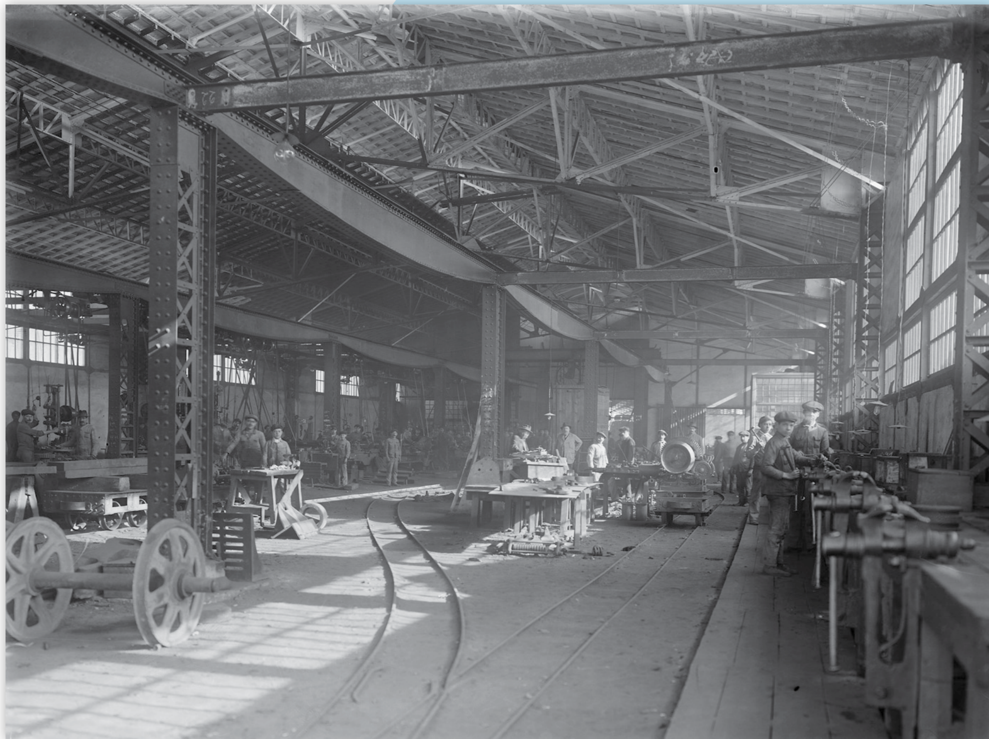
Oficinas de serralharia da EPL • 12/12/1917