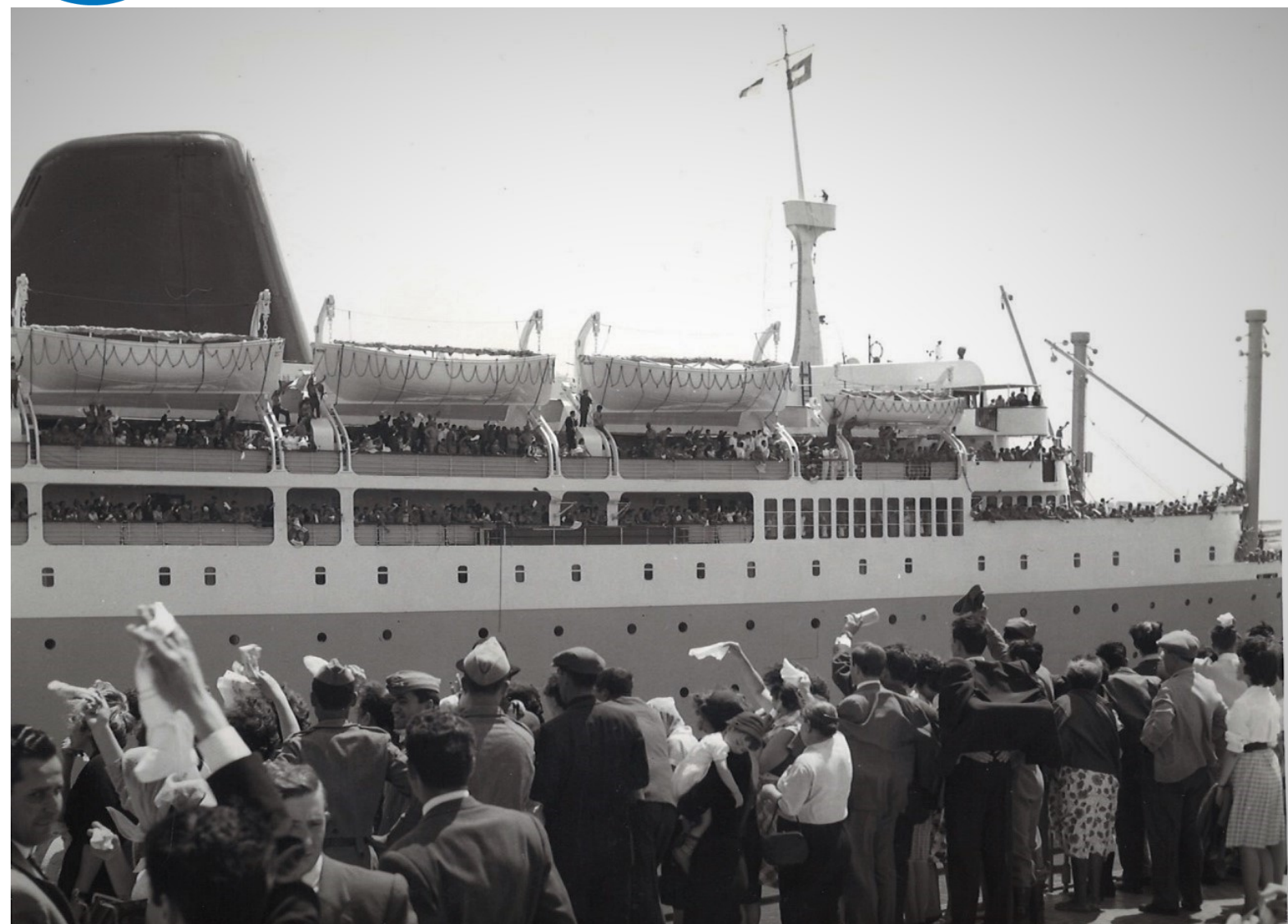
Paquete "Príncipe Perfeito" acostado ao Cais de Alcântara