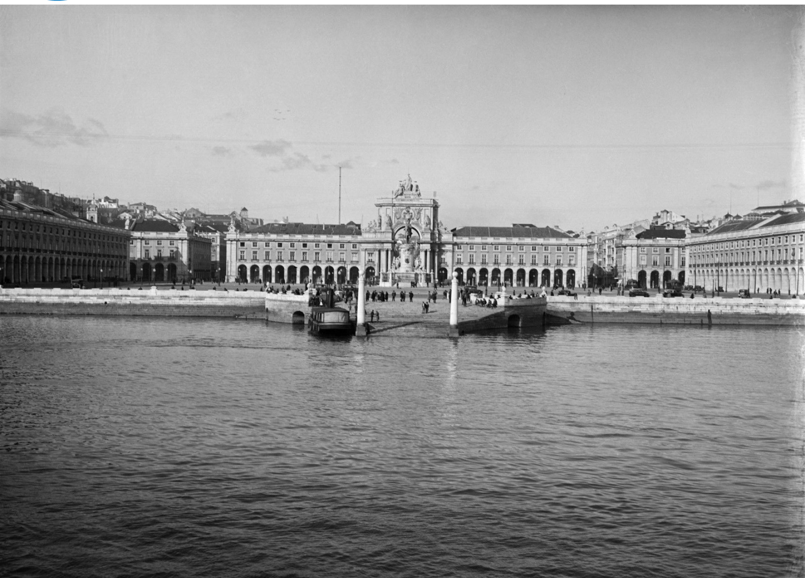
Cais das Colunas