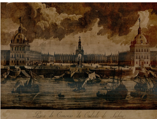
Praça do Comércio da cidade de Lisboa (sem data)

cartografia histórica à guarda deste Arquivo. No total, foram digitalizados e inventariados cerca de 35.000 desenhos dos três portos.