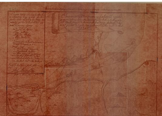
Estudo histórico hidrográfico sobre a barra e o porto de Lisboa (1893)

cartografia histórica à guarda deste Arquivo. No total, foram digitalizados e inventariados cerca de 35.000 desenhos dos três portos.