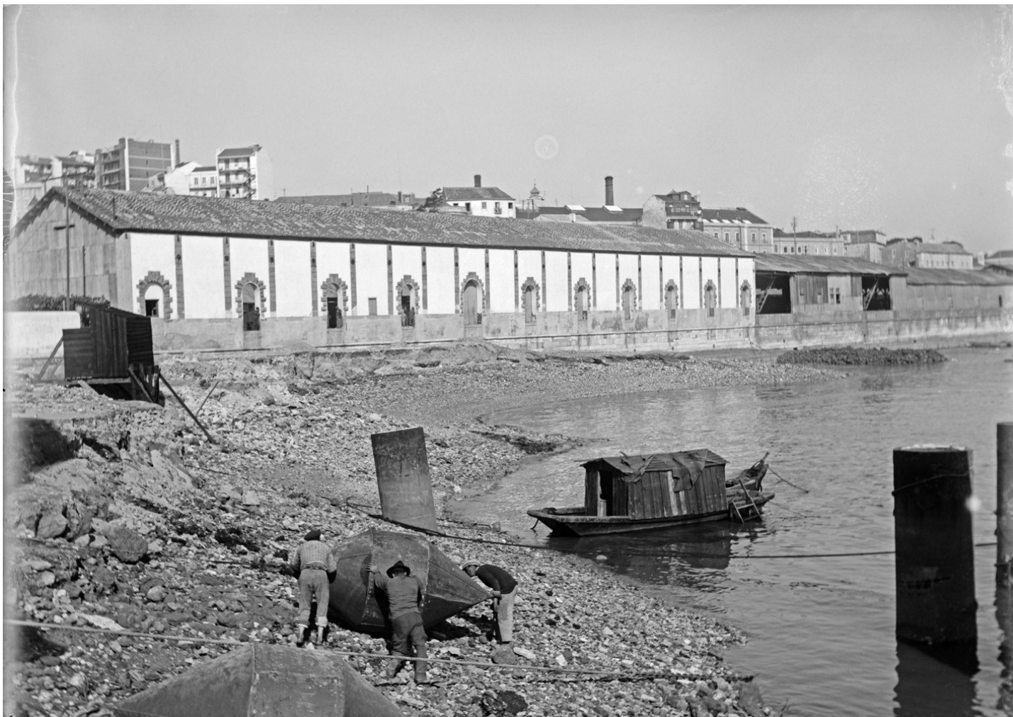
Obras da 3.ª Secção - Santa Apolónia