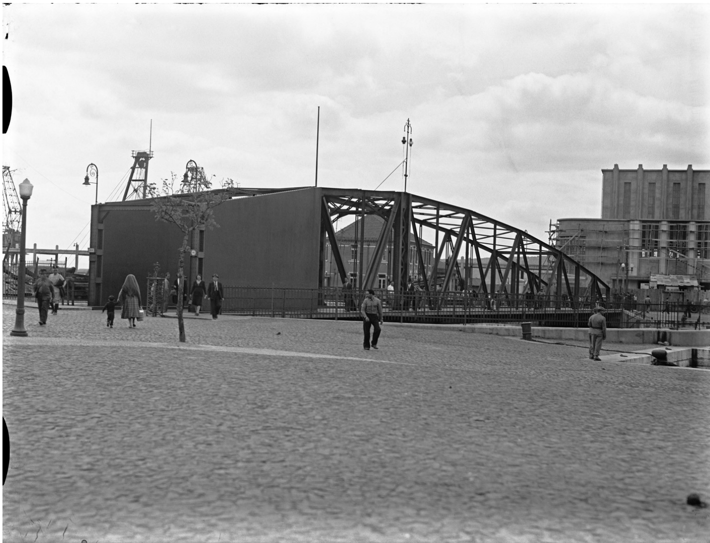
Doca de Alcântara - Ponte giratória [Gare Marítima da Rocha em construção, ao fundo]