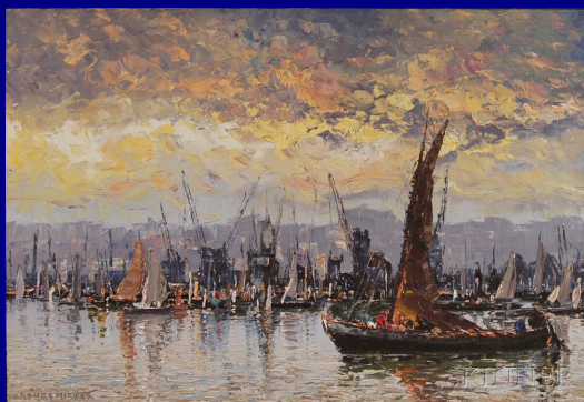
Poema de David Mourão-Ferreira Pintura de Augusto Gomes Martins - "Fragatas no Tejo"

Bela! a cidade, serena... Longe o tempo, desolado...! Perto, só tu, a meu lado, lírica barca pequena que a Vida enfim há deixado junto de mim, na serena cidade bela do fado!