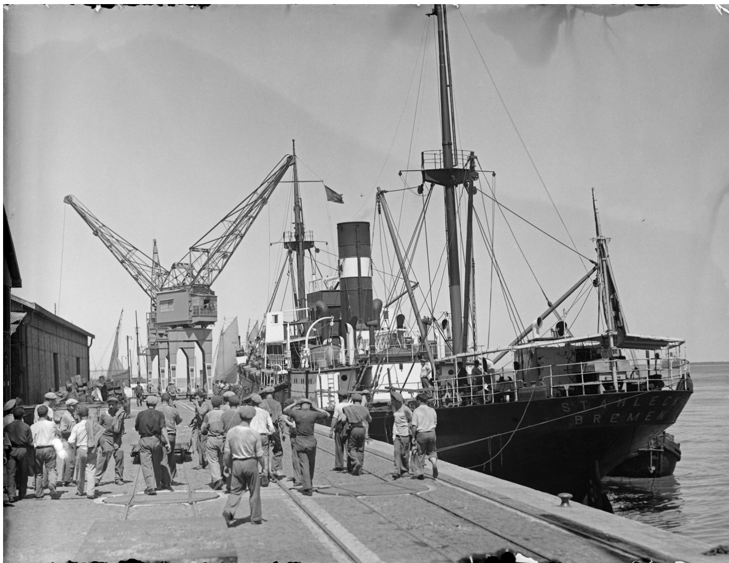
Começo da descarga de um navio alemão no Entreposto Colonial